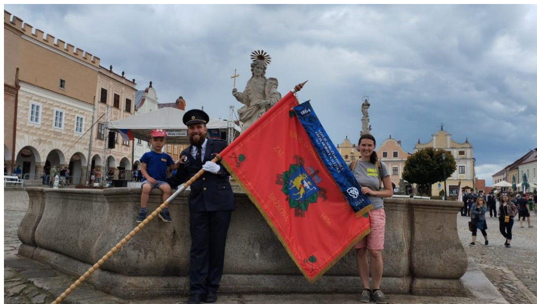
Hasiči z Držkové na setkání s prapory v Telči