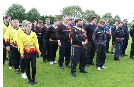
O pohár starosty OSH Litoměřice, nástup družstev, Lukavec, 3. kolo

Lukaveckým hasičům přejeme hodně úspěchů v další činnosti.