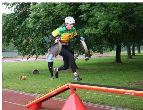
Okresní kolo dorostu, Lovosice, květen 2024

Tento pravidelný občasník je uveřejňován na stránkách SDH Lovosice ve formátu pdf a je volně ke stažení. V současné době neuvažují o papírové verzi. Informace o novém občasníku budou zasílat do Sborů a zájemcům. Kontaktovat nás můžete na mailové adrese sboru.