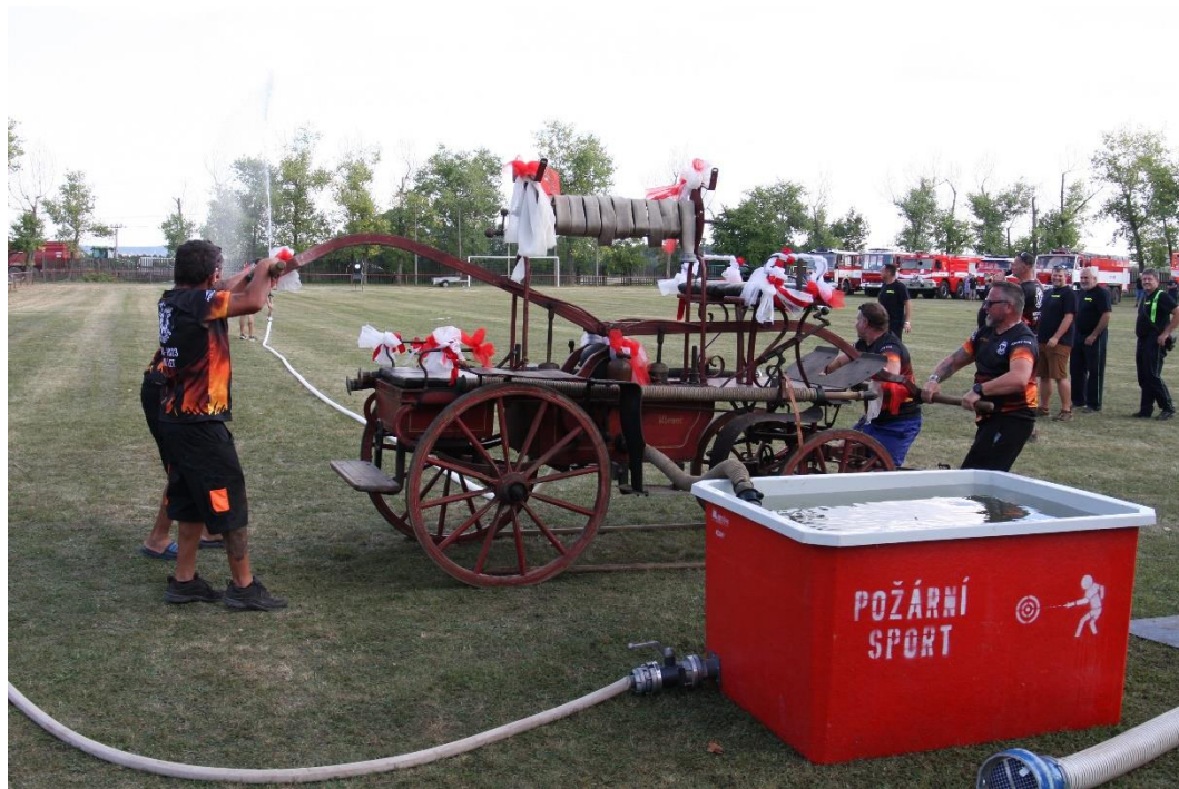
Z oslav 140 let trvání sboru v Račiněvsi, 2023

Stejně jako loni bude mít svého kmotra. Nebo kmotru? Nechte se překvapit.