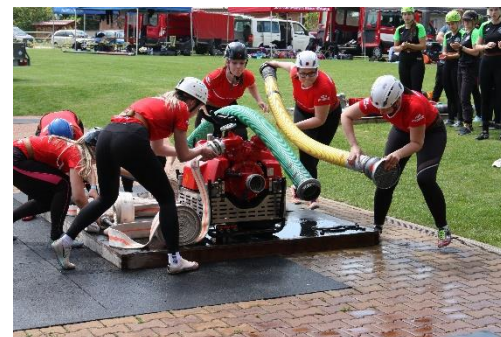
Ženy z Hrobců na okresním kole v Předoníně, květen

Děkujeme všem soutěžícím za skvělou reprezentaci sboru i okresu!