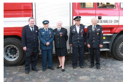
Zasloužilí hasiči okresu Litoměřice, setkání v Terezíně, podzim 2023

V následujících číslech se vám je pokusíme představit a ukázat jejich práci. Také vám přineseme zprávy o členech, kteří rovněž tento titul získali, ale dnes již nejsou mezi námi.