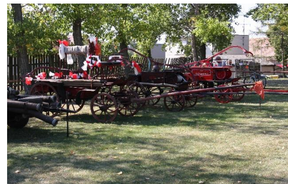
Historická technika na oslavách v Račiněvsi, 2023

V příštím vydání se můžete těšit na další zajímavost ze života našich sborů.