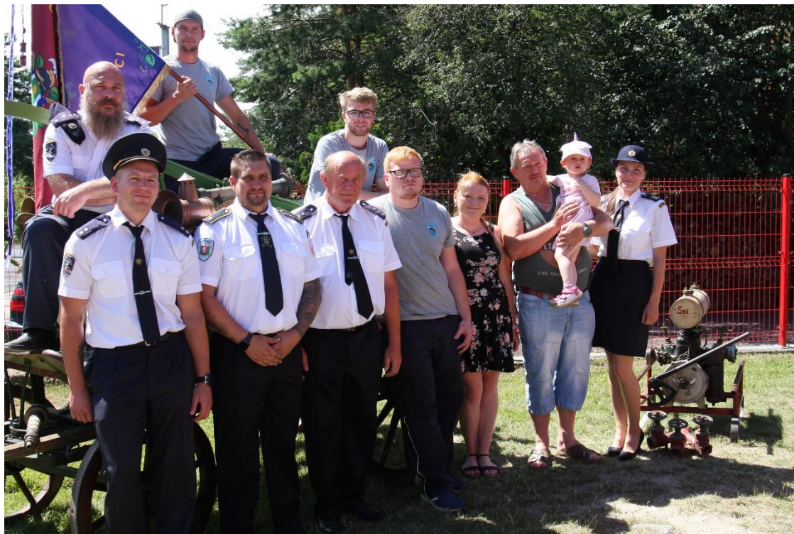
Hasiči SDH Předonín při oslavách 115. výročí založení sboru, červenec 2024