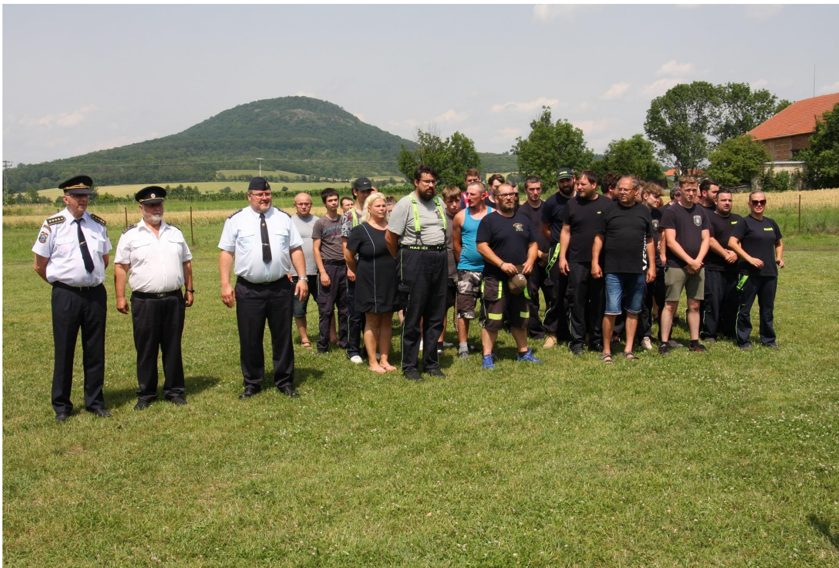
Nástup sborů pod Řípem, Mnetěš, červen 2024