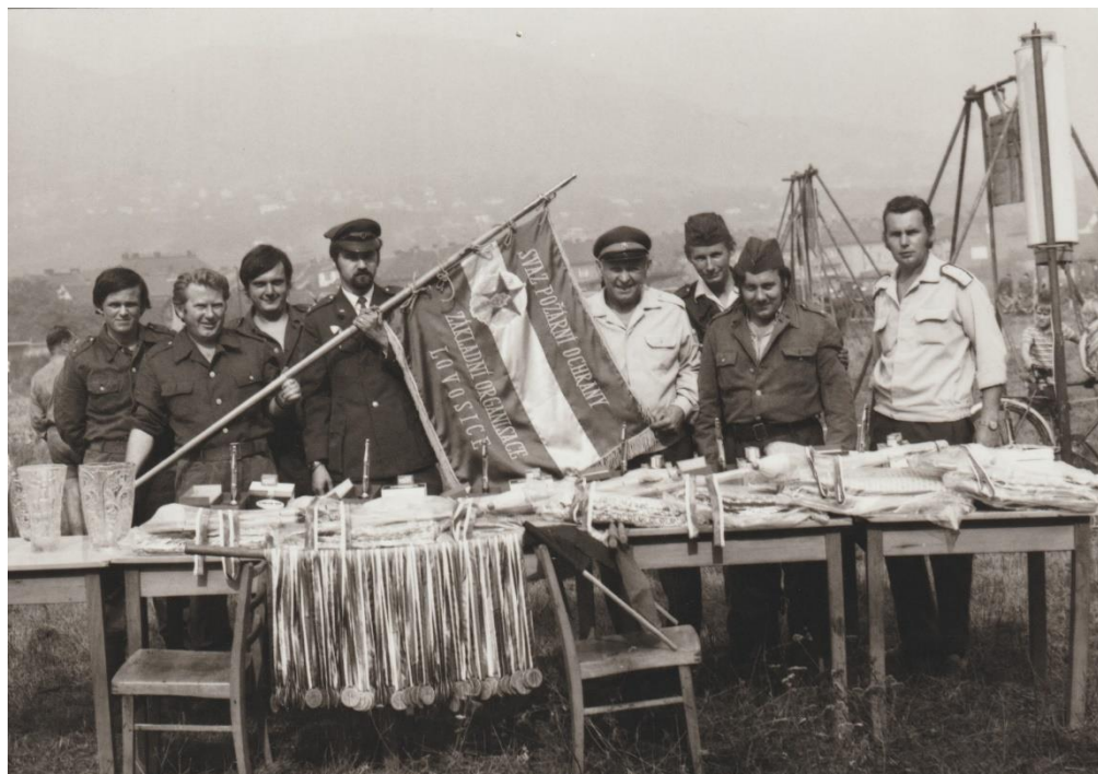
Organizace Stříbrné proudnice v Lovosicích, 70. léta

Freiwillige Feuerwehr Stadt Lobositz byl založen 27. června 1872 .