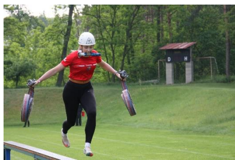
Okresní kolo dospělí, Předonín, květen 2024

Tento pravidelný občasník je uveřejňován na stránkách SDH Lovosice ve formátu pdf a je volně ke stažení. Kontaktovat nás můžete na mailové adrese sboru.