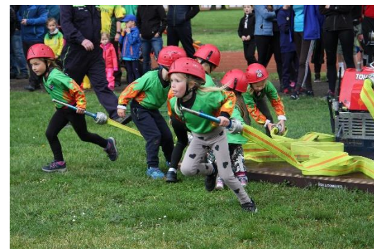
Okresní kolo Plamen – SDH Křešice, Lovosice, 2024

V příštím vydání najdete další zajímavé otázky.