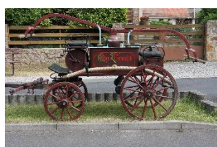
Koněspřežná stříkačka Smékal, r. 1881

Další sbor pod Řípem slavil, tentokrát 120 let od založení