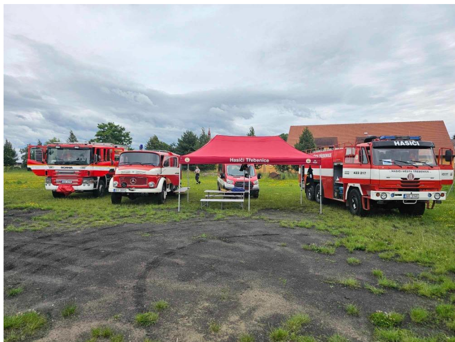
Technika JSDHO Třebenice

Všem oceněným blahopřejeme a přejeme hodně úspěchů v další práci.