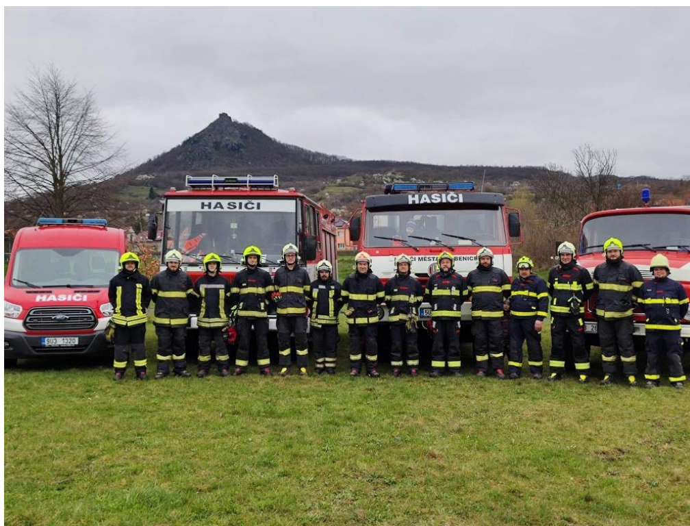
Jednotka sboru dobrovolných hasičů obce Třebenice