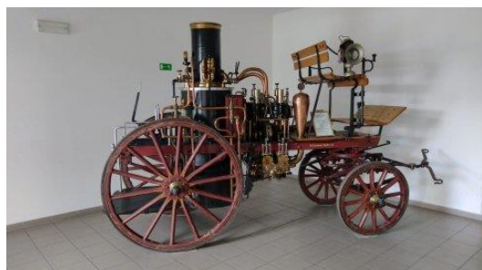
Plnou parou do nového roku

Tento pravidelný občasník je uveřejňován na stránkách SDH Lovosice ve formátu pdf a je volně ke stažení a šíření. Kontaktovat nás můžete na mailové adrese sboru.