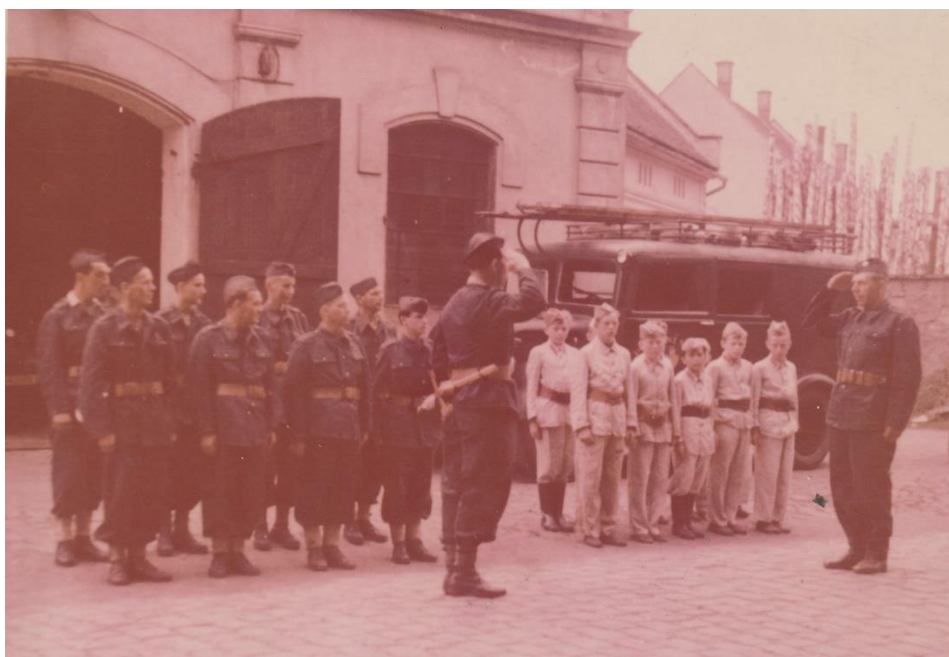
SDH Lovosice – soutěžní družstva 60. léta