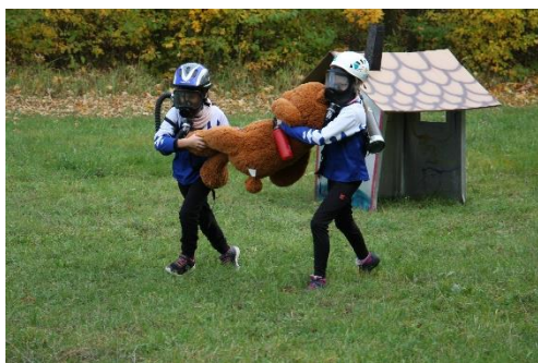
Záchrana medvěda, ukázka na setkání na Řípu

Tento pravidelný občasník je uveřejňován na stránkách SDH Lovosice ve formátu pdf a je volně ke stažení a šíření. Kontaktovat nás můžete na mailové adrese sboru.