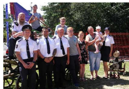
Z oslav výročí v Předoníně, rok 2024