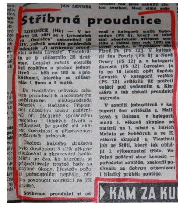
Z tisku – XIV. Ročník Stříbrné proudnice

V dalším pokračování si řekneme o elektronickém vedení kroniky.