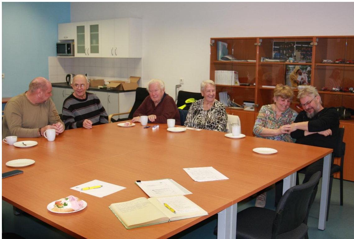
Z valné hromady sboru, leden 2025