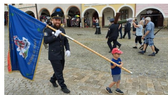
Hasičské prapory v Telči, 2024

Můžete se těšit na příští vydání, kde najdete další zajímavé otázky.