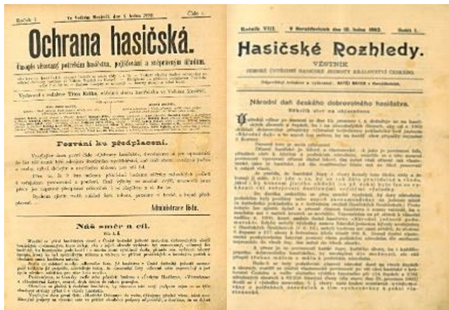
Ochrana hasičská, časopis vydávaný od roku 1892; Hasičské Rozhledy vycházely od roku 1902