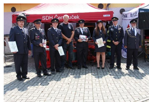
Z kalendáře – oslavy výročí Černošice 2024

https://www.hasicovo.cz/cs/zpravy/podcast-kalendar-z-lovosic