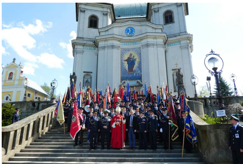
Mezinárodní hasičská pouť na Sv. Hostýn, duben 2024