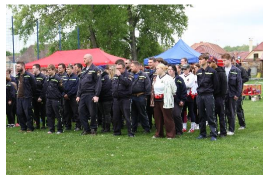
Pohár starosty OSH, Bechlín 2024

Jestli v letošním roce slavíte výročí sboru, případně pořádáte jiné akce, nezapomeňte uvést i tyto skutečnosti s termínem konání.