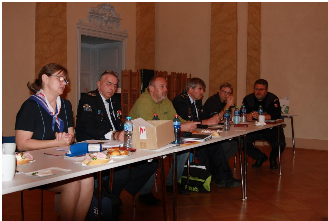
Z podzimního setkání starostů a OSH v Terežíně, listopad 2024