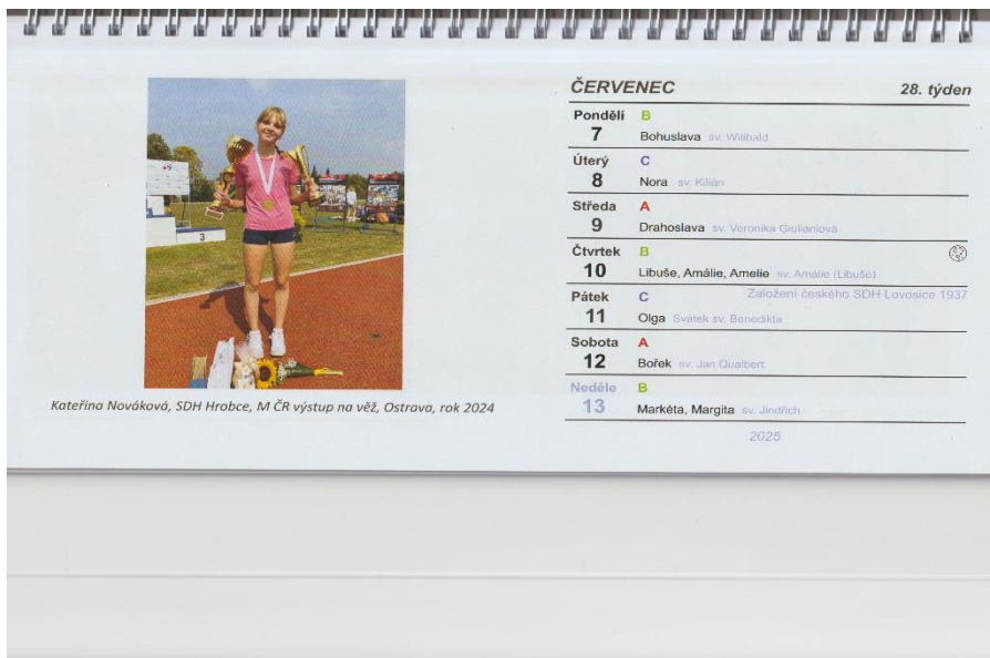
Výročí založení českého Sboru dobrovolných hasičů v Lovosicích v roce 1937