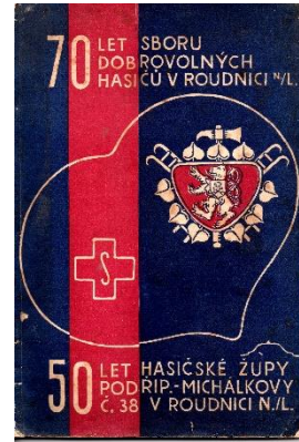
Publikace k 70. výročí sboru a 50. výročí hasičské župy v Roudnici nad Labem

V dalším pokračování si řekneme o nákladech, které souvisí s vedením kroniky.