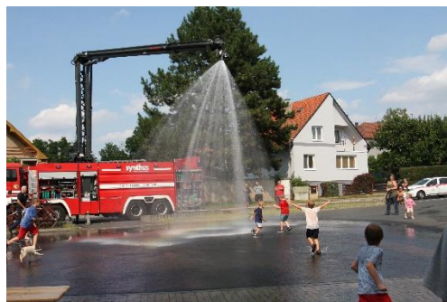
Z oslav výročí v Černoučku, srpen 2024

Tento pravidelný občasník je uveřejňován na stránkách SDH Lovosice ve formátu pdf a je volně ke stažení a šíření. Kontaktovat nás můžete na mailové adrese sboru.