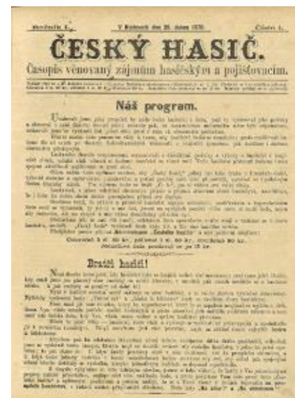
První číslo časopisu Český hasič vyšlo 25. dubna 1878

Můžete se těšit na příští vydání, kde najdete další zajímavé otázky.